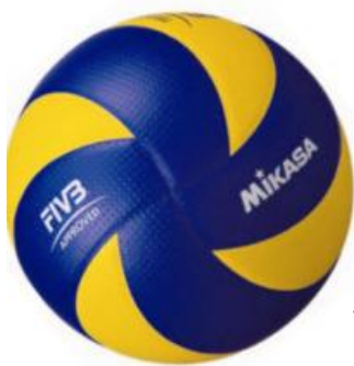
Nuværende kampbold, Mikasa MVA 200

Tilbud ved køb af mindst 36 bolde – Pris: kr. 400 ex. moms