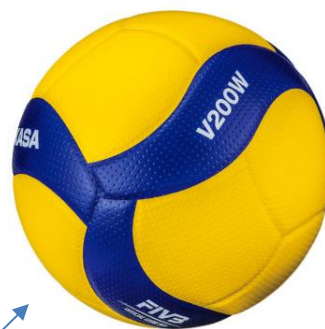
Ny kampbold, Mikasa V200W