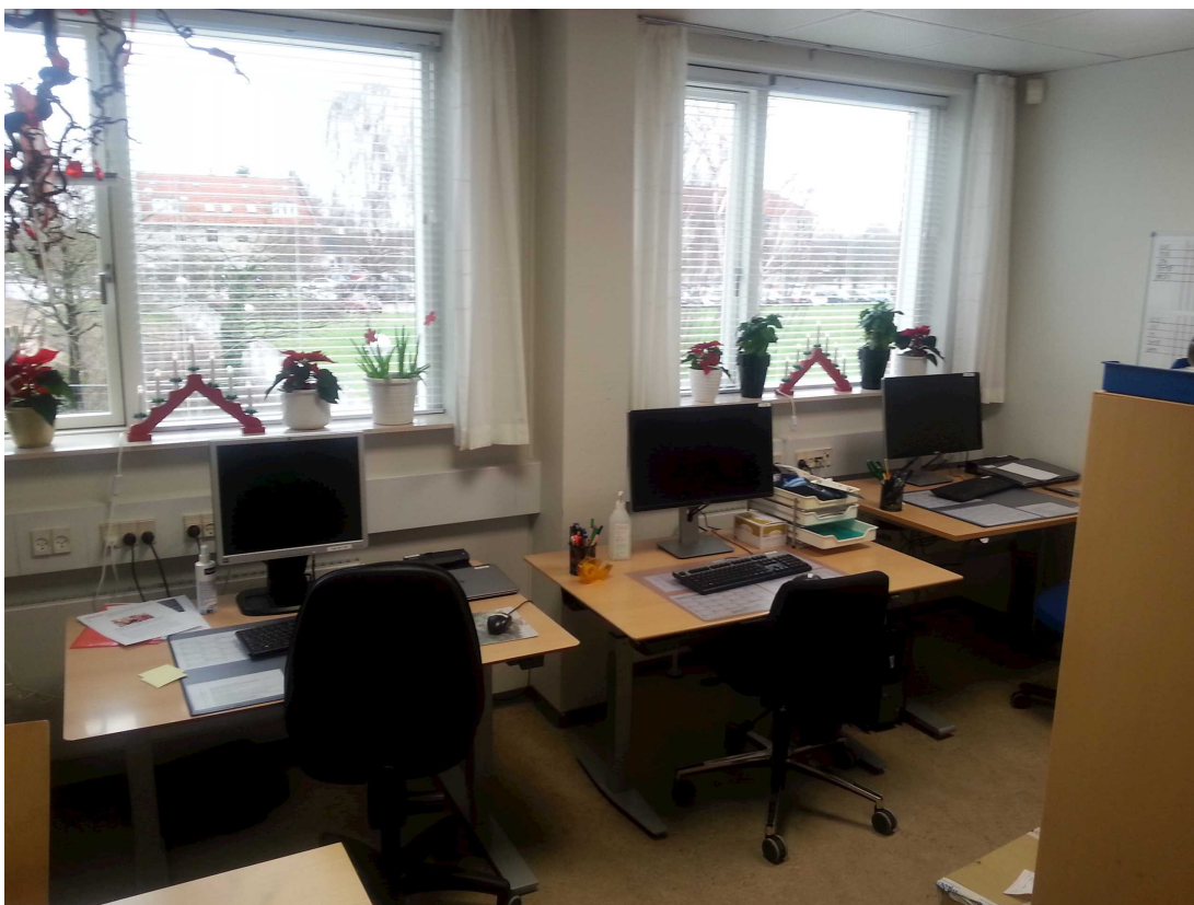
På billedet ses skærmarbejdspladserne i kontor E 108. Der er opstillet 5 skærmarbejdspladser i lokalet.