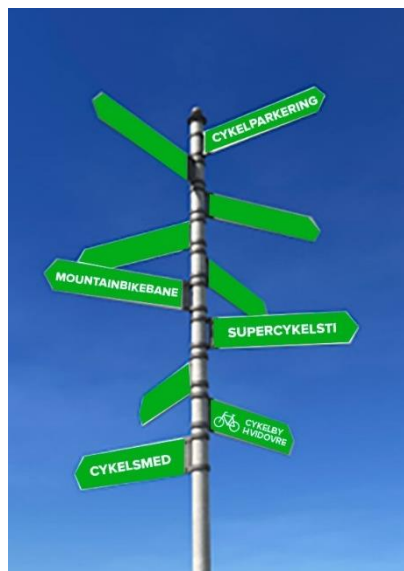
Et cykelskilt i bymidten