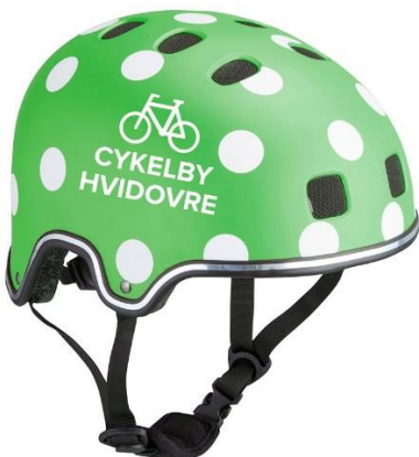
Logo på præmier til cykelkonkurrencer