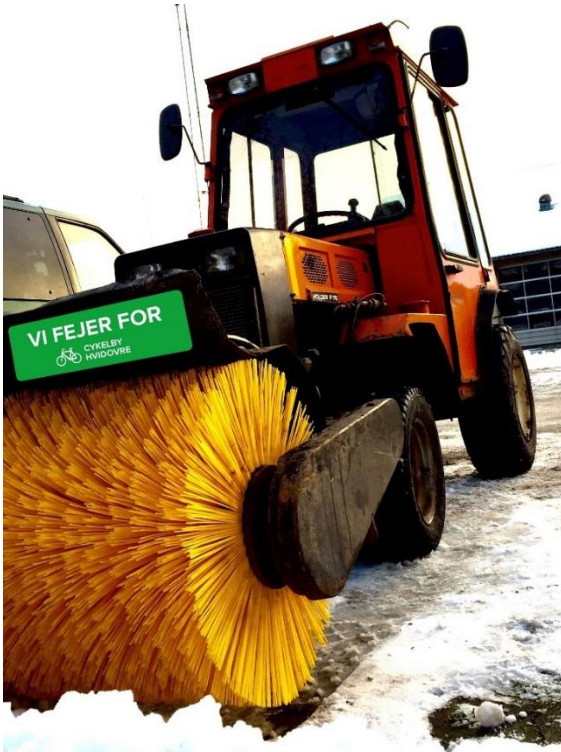
På fejmaskiner, der fejer på byens cykelstier

Her kan du se eksempler på hvordan man kan synliggøre Cykelby Hvidovre i byens rum og indsatsen for at gøre byen cykelvenlig.