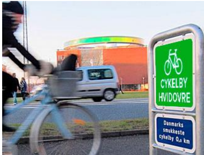
Som markering af indsatsen på skilte