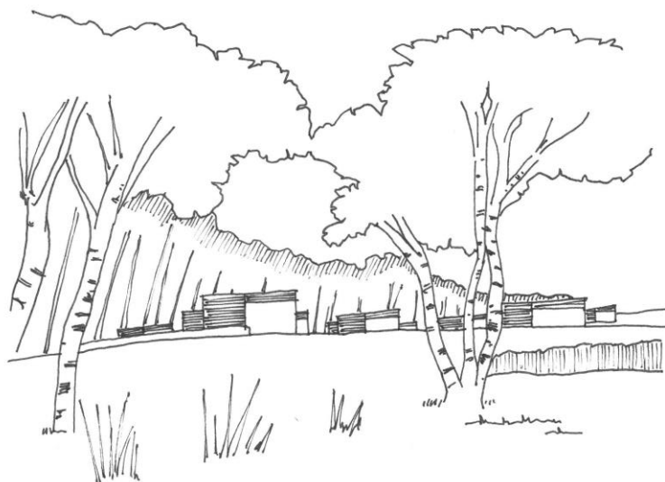
Eksempel på tæt-lav i grønne omgivelser

Det foreslås, at vejforløbene ændres, så der ikke opstår gennemkørende trafik, og at der evt. etableres lyssignal i krydset Lagesminde Allé/Gammel Køge Landevej.