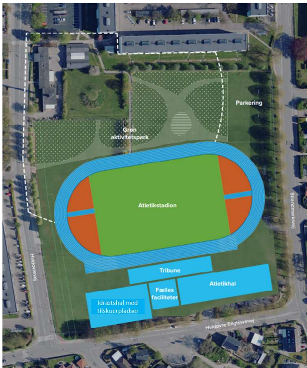
Illustrativt - Idé til udvikling af området ved Strandmarkens Fritidscenter

Efter dialog med Boldklubben Friheden og Hvidovre Atletik er det vurderingen, at der vil være behov for at finde et nyt, egnet sted til etablering af faciliteter til Boldklubben Friheden – i nærheden af området ved Strandmarkens Fritidscenter og gerne et sted, hvor klubben allerede har aktiviteter i dag.