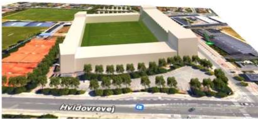
Illustrativt - Eksempel på udbygget stadion, der lever op til Divisionsforeningens krav til at spille i Superligaen

Det eksisterende stadion udbygges til et moderne stadion, der giver plads og rummer udviklingsmuligheder - lige fra superliga til seriekubber i Hvidovre. For eksempel udvides stadion med tre ekstra tribuner, der er med til at lukke stadionet af.