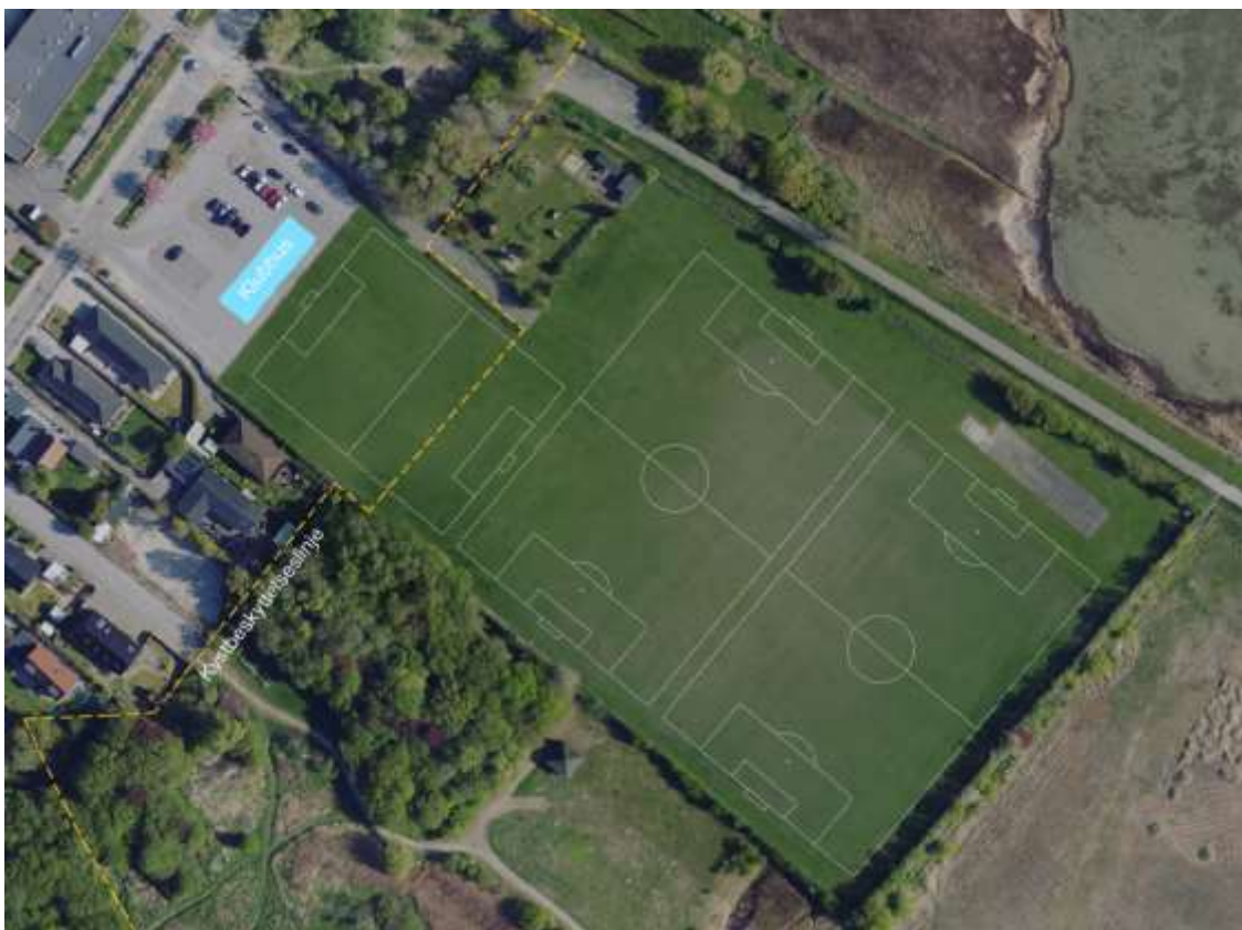
Illustrativt - Idé til nye faciliteter til Boldklubben Friheden på området bag Langhøjskolen med klubhus og 2,5 kunstgræsbane

Vigtige opmærksomhedspunkter, der skal tages hensyn til ift. etablering af nyt atletikstadion på SFC-grunden: