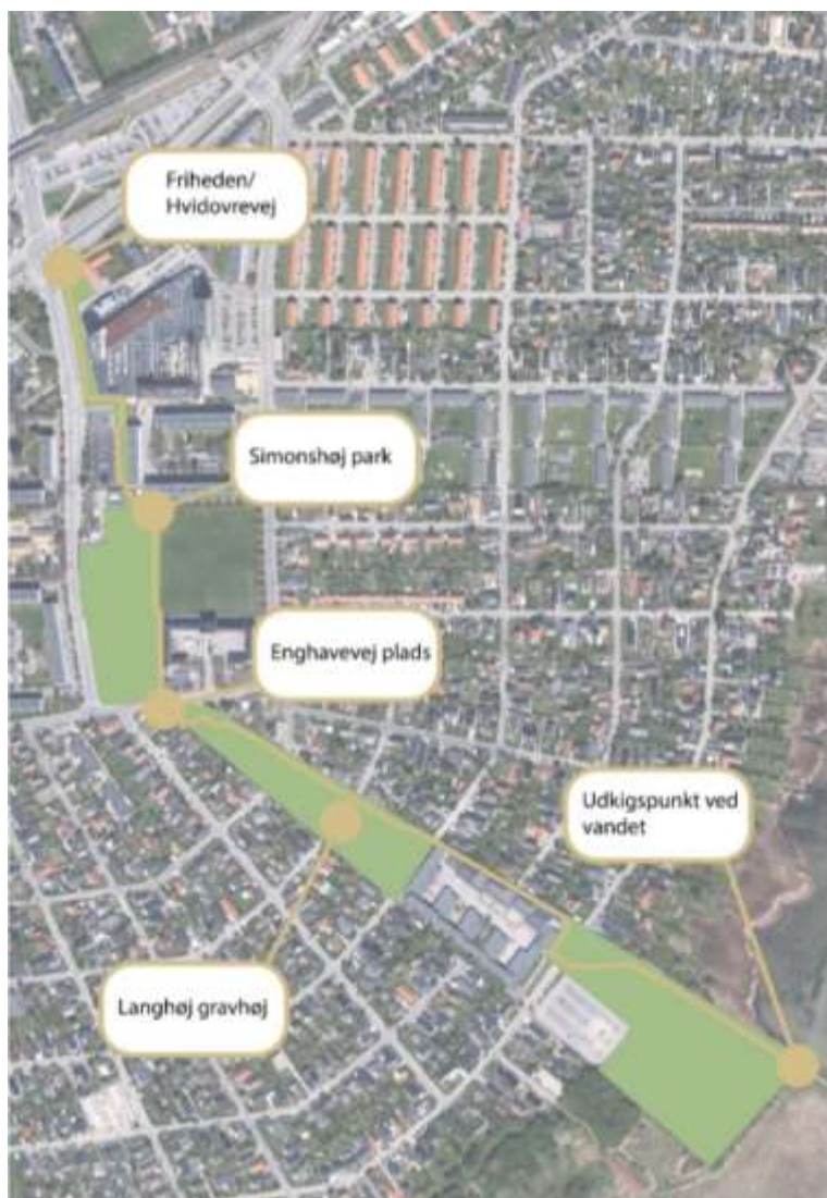
Illustrativt - Idé til etablering af grøn kile som del af samlet byudvikling af området fra Friheden/Hvidovrevej til kysten

Der skal tages stilling til parkens omfang, men der er mulighed for at etablere parken som en del af et sammenhængende stisystem fra by til vand – potentielt hele vejen fra Friheden/Hvidovrevej til kysten. Med et sådant stisystem forbindes områdets to fortidsminder Simonshøj og Langhøj, og det vil være oplagt at lade stisystemets karakter tage afsæt i bronzealderen og gravhøjene. For eksempel med brug af bronzealderens ikonografier og genstande, og etablering af interaktive informationsstationer ved gravhøjene.