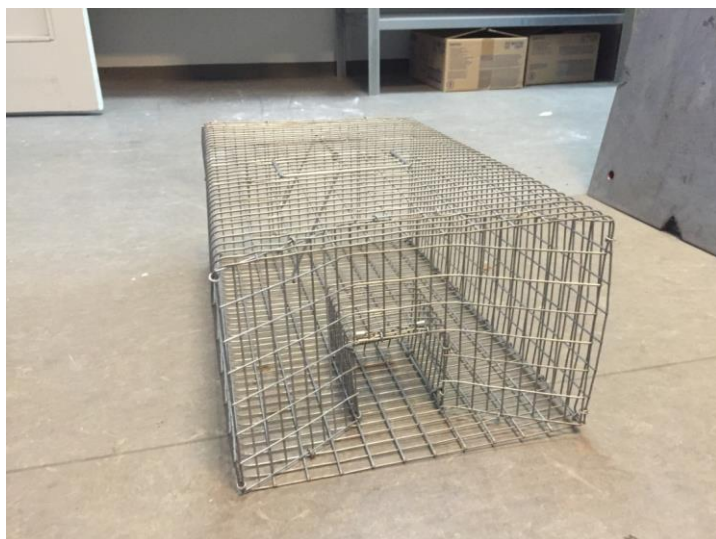
Burfælde uden lokkemad.

I burfælden sættes et lokkemiddel (giftfrit) det kan være en fuglekugle, noget sveskepasta eller lignende.