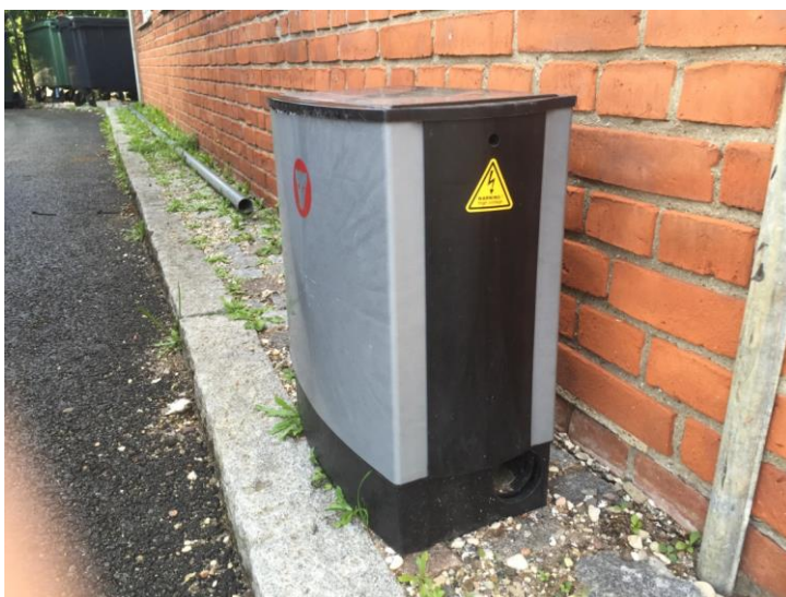
Wisebox klar til brug

Ulempen er, at rottebekæmperne har testet wisebox'ene og der ofte er fejlalarmer, således at der bliver foretaget fejludrykninger. Grundet det store pres på rotteområdet er det pt. ikke ressourcer til at teste wiseboxene yderligere. Men rotteteamet håber på, at få dem testet i løbet af 2017, for boksene kan være gode på steder, hvor man ikke har lyst til at se rotten i en fælde.