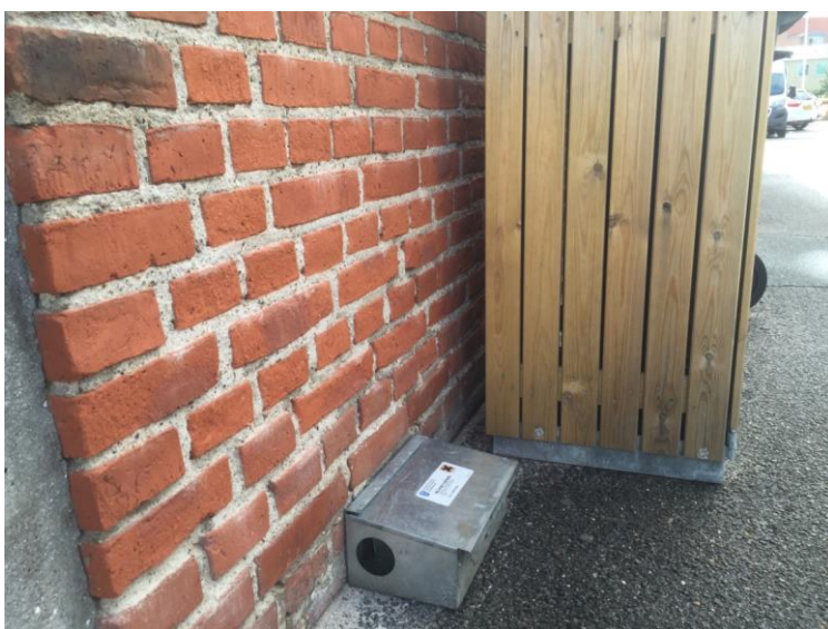
Giftdepot stående tæt på et affaldsstativ.

I giftdepotet kan der lægges korn, pasta, fast giftblok og lignende. Giftdepotet kan bruges både med og uden gift. Det fungerer på den måde, at rotten bliver lokket til depotet af det udlagte materiale og begynder at spise af det. Giften går i rottens blodkar og rotten dør, når den har taget en bestemt dosis af giften. Rotter er kloge, og de går derfor ikke altid i depotet lige med det samme, men har depotet først været brugt af en rotte, er det nemmere at tillokke nye rotter. Derfor er et brugt depot meget bedre end et nyt.