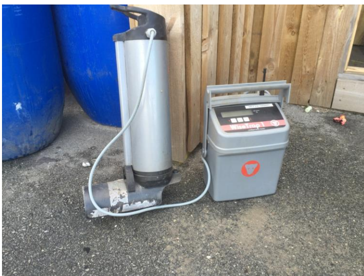
Wisetrapp der skal installeres i en kloak.

Det kræver autorisationen som kloakmester samt uddannelse som autoriseret rottebekæmper eller certificeret rottespærremontør for at opsætte wisetraps. Kommunen har pt. ingen autorisation som kloakmester og må derfor ikke selv opsætte dem, selvom en af rottebekæmperne har en kloakmesteruddannelse.