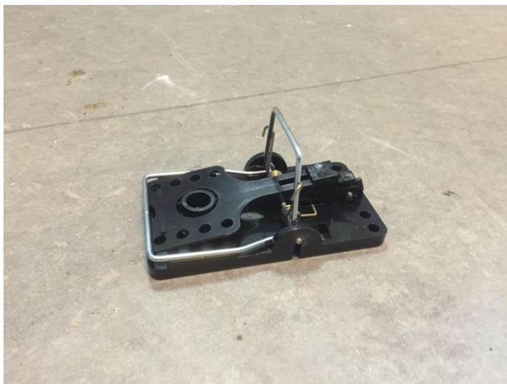
Figur 3 Smækfælde uden lokkemad.

Ellers bruges smækfælden ofte indendørs og i garager, carporte, anneks og lignende steder.