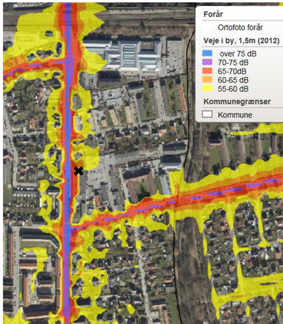
Figur 2. Støj kortet viser støjbelastning langs Hvidovrevej i 1,5 m højde. Føtex med tilhørende p-plads beliggende i rammeområde 1C14 er markeret med et sort kryds [15].

En forøgelse af centerområderne og muligheden for at øge butiksarealerne kombineret med en fortætning af boligmassen vil give anledning til øget støjpåvirkning af borgerne langs Hvidovrevej, der allerede i dag er præget af tæt trafik og støj. Ifølge Miljøstyrelsens støjkort [15] er strækningen på Hvidovrevej, bl.a. ved Føtex og Hvidovre Stationscenter præget af støj på 65-70 dB (se Figur 2). Flere steder ligger der boligblokke helt ud til vejen, og her kan der ifølge støjkortlægningen forventes en støjpåvirkning ved de helt vejnære boliger på 70-75 dB (fx rammeområde 1B18 og dele af 1C14 på hver side af Føtex)