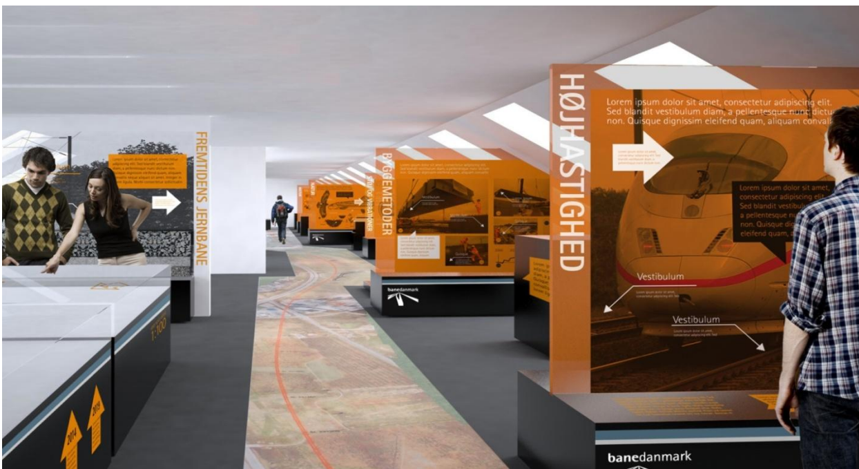
Et kig ind i infocentret.

Vi holder åbent for alle den første tirsdag i måneden fra kl. 13 til kl. 18. Der er gratis adgang.